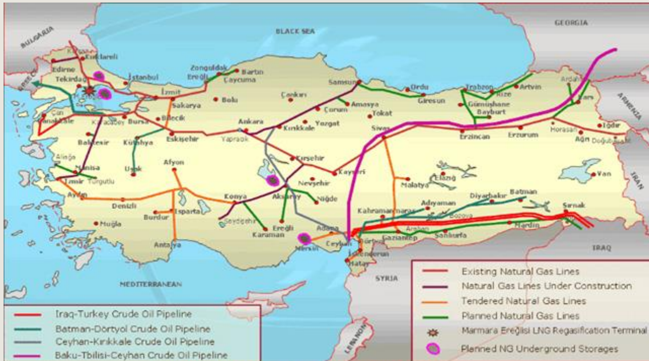
Turkey's Oil and Gas Pipeline Network