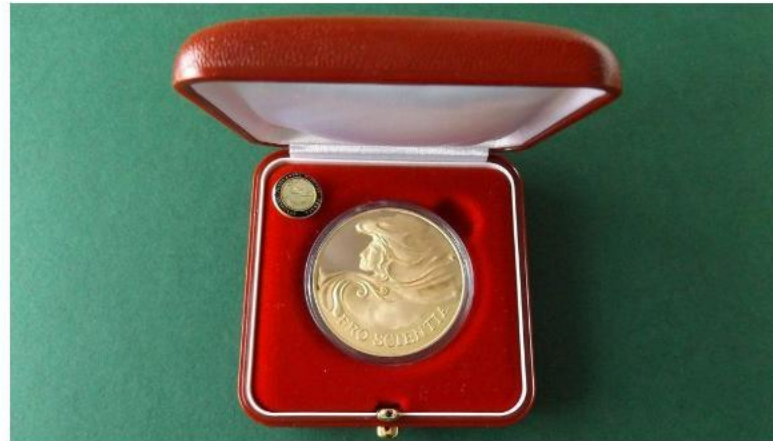
„Pro Scientia Aranyérem”