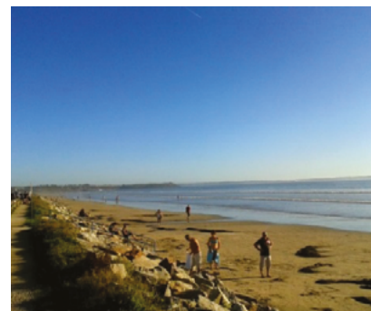
Saint-Cyr Coëtquidan, Franciaország

http://www.kormany.hu/hu/kulgzdasagi-es-kulugyminiszterium/kulkepviseltek