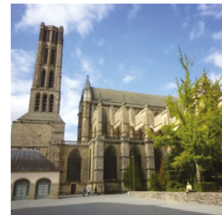
Limoges, Franciaország