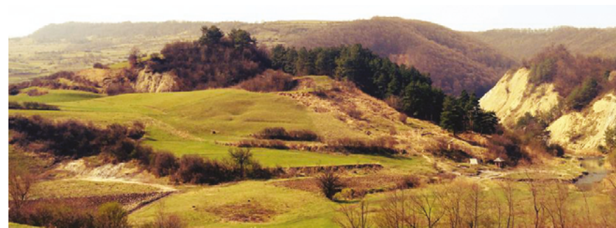
© Tóth Kinga, Sapientia Erdélyi Magyar Tudományegyetem, Románia